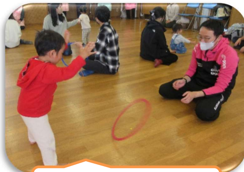
コロコロ～上手に出来た。