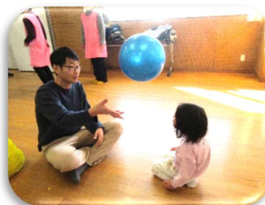
学芸大学生がお手伝いに来ましたよ。